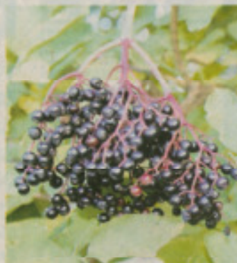
Holunderbeeren, die reif zur Ernte sind.

gibt verschiedene Holunderarten, wobei der schwarze Holunder Sambucus nigra bei uns am meisten verbreitet ist. Wurzeln, Rinde, Blüten und Früchte können genutzt werden, Inhaltsstoffe wie ätherische Öle, Mineralstoffe Kalium, Calcium, Natrium, Gerbstoffe, Farbstoffe und die Vitamine A, B und C sorgen für die vielfältigen gesundheitlichen Aspekte. Jetzt ist die Zeit zum Sammeln der Beeren, die nur absolut reif und niemals roh verwendet werden sollen.