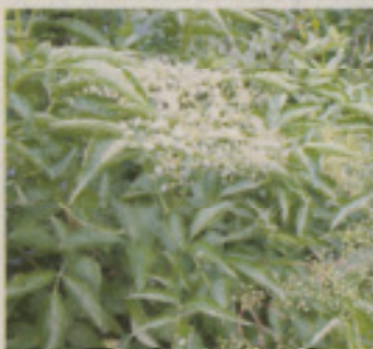
Der Holunderstrauch in voller Blüte.

(jrö). Der Holunder gehört zu den ältesten Heilpflanzen in der Volksmedizin. Aufzeichnungen über seine vielfältigen Heilwirkungen sind Jahrhun-